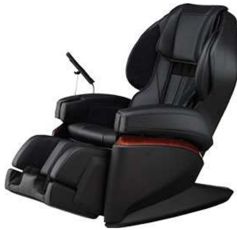
リラックスソリューション SKS-7100 マッサージチェア H55

メーカー希望小売価格 販売価格については 693,000円(税込)⇒お問合せ下さい。