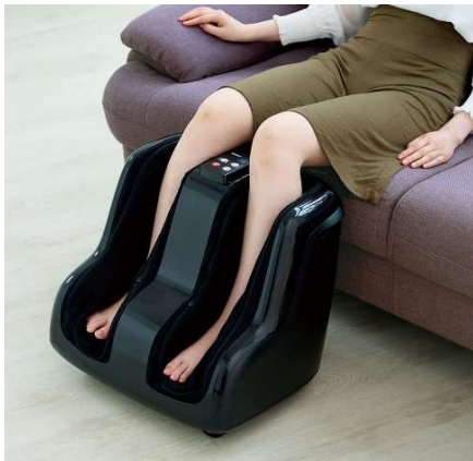
フットマッサージャー FT-200

メーカー希望小売価格 販売価格については 60,280円(税込)⇒お問合せ下さい。