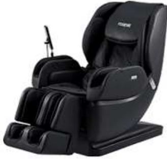
マッサージチェア MO57 OH-5000

メーカー希望小売価格 販売価格については 605,000円(税込)⇒お問合せ下さい。