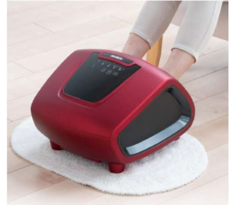
フットマッサージャーF FSK-100 エア楽〜く

メーカー希望小売価格 販売価格については 209,000円(税込)⇒お問合せ下さい。