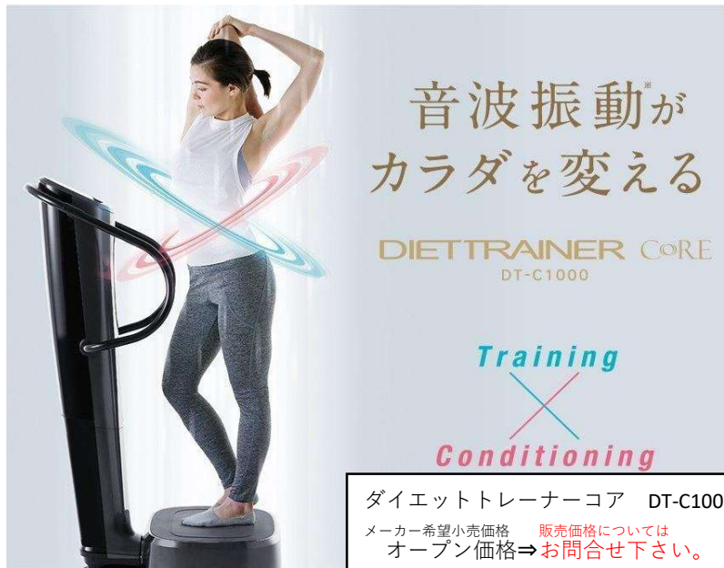
ダイエットトレーナーコア DT-C1000